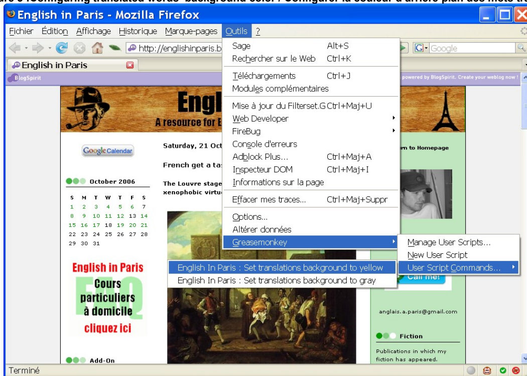
Figure 3 :Configuring translated words' background color / Configurer la couleur d'arrière plan des mots traduits

Hope it will help you to learn English with Adam. Enjoy. Franck Depierre.