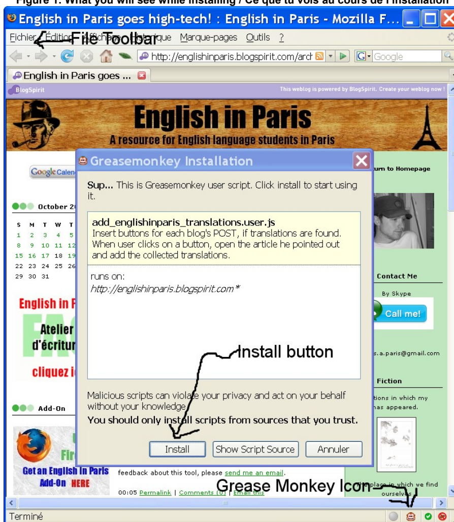
Figure 1: What you will see while installing / Ce que tu vois au cours de l'installation